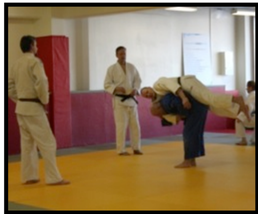
Nage-no-katan Ippon-seionagen harjoittelua